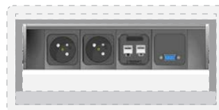
2 modules courant fort type France 1 module 2Gcoupleurs réseau RJ45 cat.6 1 module VGA