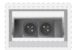
2 modules courant fort type France