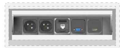
2 modules courant fort type France 1 module Gcoupleurs réseau RJ45 cat.6 1 module VGA, 1 module HDMI