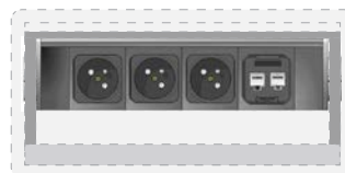
3 modules courant fort type France 1 module 2Gcoupleurs réseau RJ45 cat.6